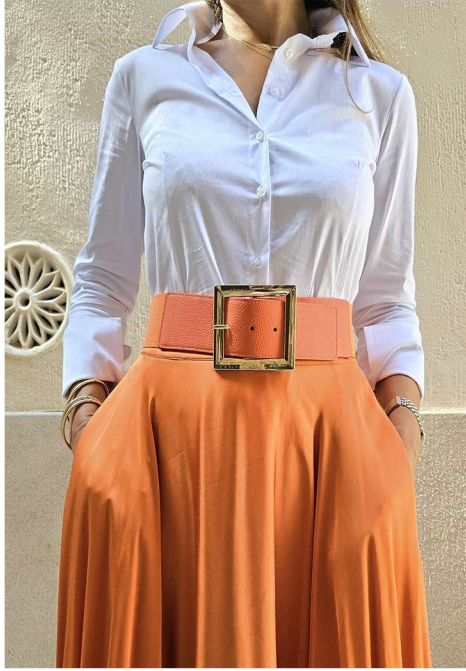
CAMISA/SHIRT BASIC ART. 6386 (Medida/Measurement CM)